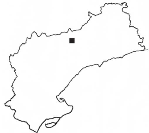
Figura 1. Localització de les localitats catalanes de Gittenbergia sororcula a la província de Tarragona.