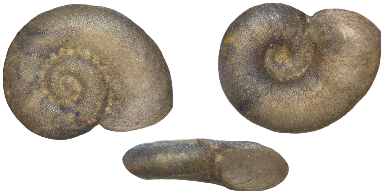
Figura 3. Gyraulus crista , Albereda de Santes Creus. Escala 1 mm

desaparició d'alguna població de G. crista en realitzar segones visites a localitats on l'espècie havia estat citada. Tot i això, és un bon senyal el fet que G. crista encara manté una notable presència poblacional a Catalunya, segons es desprèn de l'abundància de citacions amb presència d'animals vius i/o conques fresques.